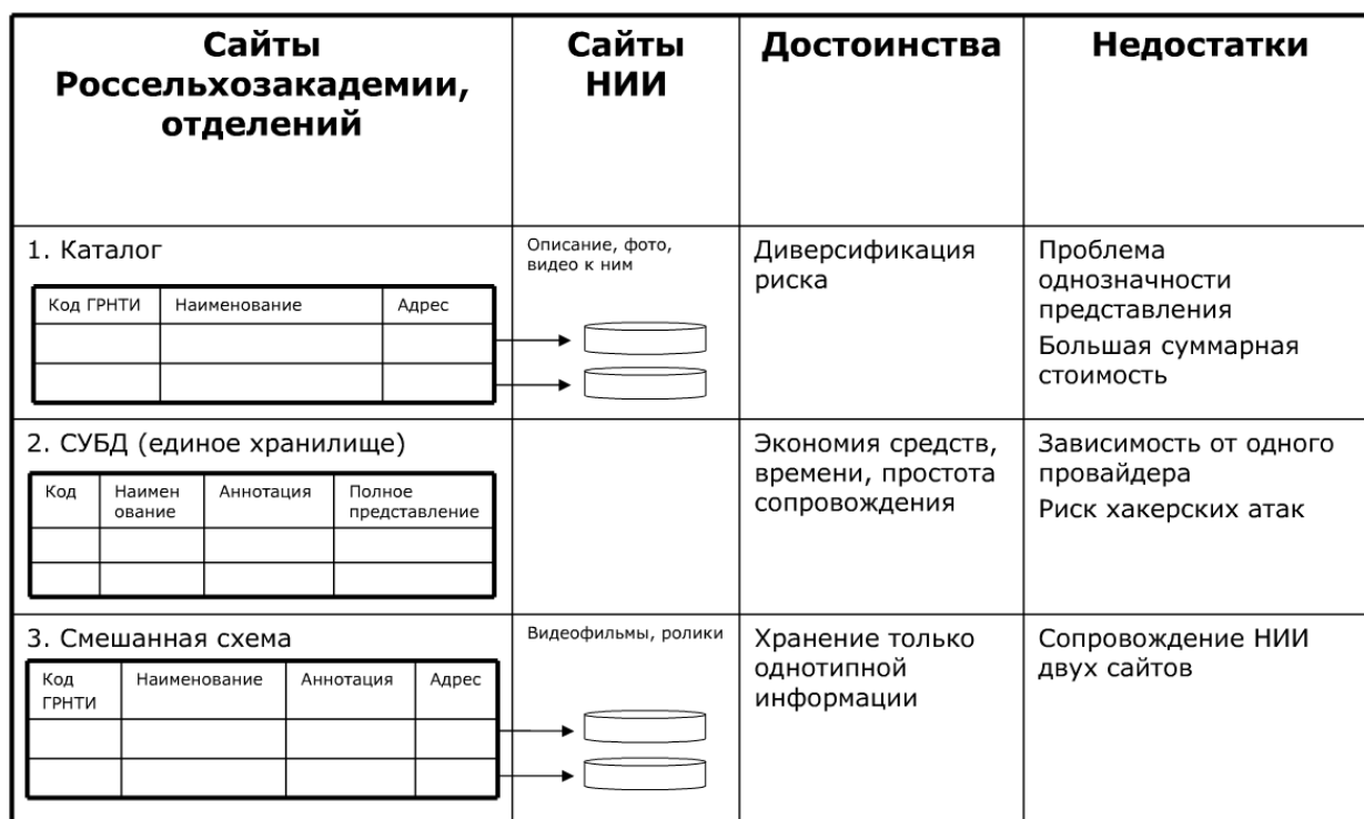
Рис. 2. Варианты интеграции информации в ЕИПА3

Качество обслуживания провайдером пользователей при этом обычно измеряется несколькими параметрами: надежностью сети, временными задержками при передаче информации, статистическими характеристиками задержек, пропускной способностью. Поскольку мы хотим выявить глобальные характеристики сети при переносе информации большим количеством владельцев ее к одному провайдеру, не обладая конкретными объемами этой информации (на сайтах выложена лишь незначительная часть ее в плохо структурированном виде), то мы будем моделировать процессы на достаточно большом интервале времени, например, месяц. На данном промежутке актуальность имеет лишь пропускная способность сети.